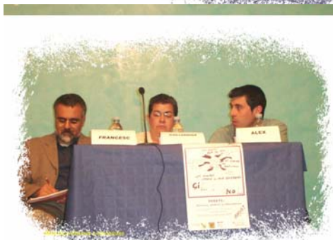
Mesa de los profesores y educadores