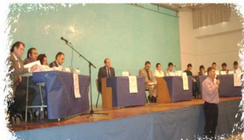
Las tres mesas del DEBATE: La primera a la derecha la representación de padres. En el centro la de profesores y educadores, al fondo los jóvenes.

La sociedad en que vivimos les hace consumistas. No se puede generalizar, hay quien quiere estudiar y quien no. La crisis es ideológica: los valores tradicionales han desaparecido, el valor actual es la TV.