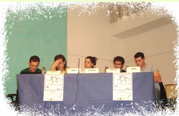
Mesa de los jóvenes