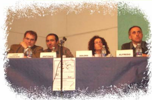
Mesa de los padres

Muchos jóvenes no ven como opción el estudiar porque supone dinero, salir poco preparados a nivel práctico y con poca competencia para salir al extranjero (al salir del cole no sabes inglés).